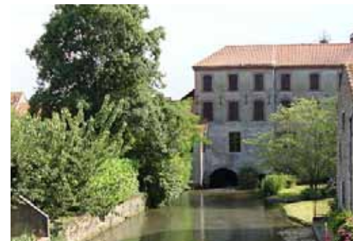
Moulin à Maubourguet

Autour de l'exposition du CAUE "Architecture de l'eau", le long des canaux de l'Adour et de l'Échez une balade commentée est proposée pour mieux comprendre l'urbanisme de la ville de Maubourguet, découvrir son patrimoine historique, naturel et bâti.