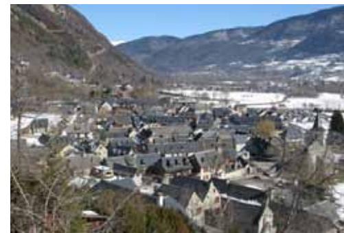
Village de Vignec

Le travail du CAUE montre les motifs communs par leurs usages et leurs symboles, mais toujours renouvelés dans leurs formes : villages étalés dans la plaine, villages rues sur les crêtes, villages accrochés sur la pente : de nombreux caractères les distinguent.