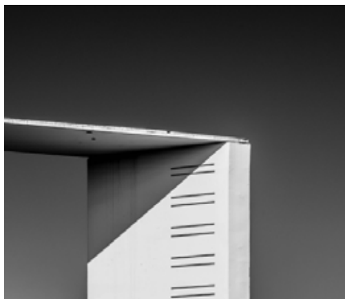
Tarbes, Clinique Ormeau-Pyrénées - Photo D. Banks

Animation d'un atelier d'initiation à la prise de vue photographique.