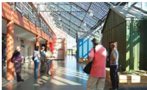
Bordères-sur-Echez, école - Architecte JP Pagnoux

Exposition de projets d'architectes du département des Hautes-Pyrénées qui ont pour objectifs de réduire l'impact négatif du bâtiment sur son environnement et de maîtriser en particulier la consommation d'énergie : choix des techniques, des méthodes de gestion, sélection des matériaux employés et organisation interne des fonctions et des espaces.